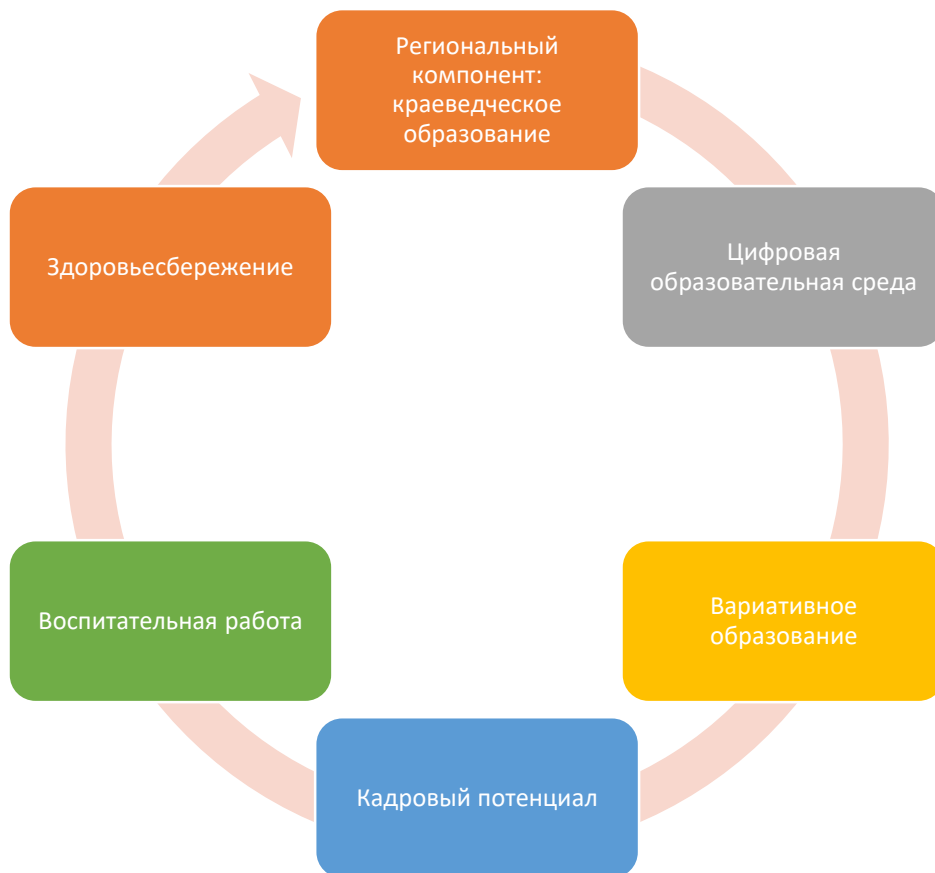
Рис.1. Целевые проекты программы развития

Основные направления изменений в системе образования Василеостровского района обеспечиваются через реализацию шести проектов (Рис.1).